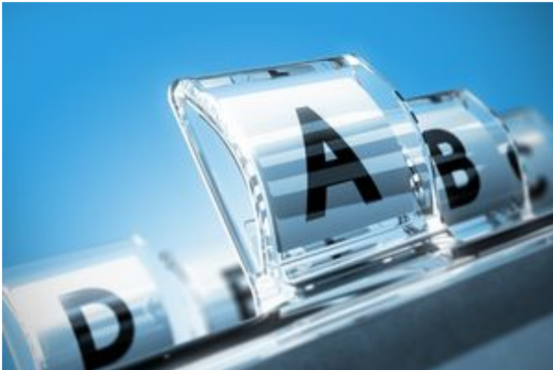
Annuaire des services