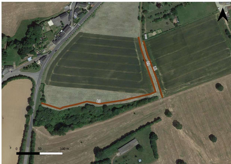
Linéaires de restauration de bocage envisagé

Le montant prévisionnel de l'opération est estimé à 8 000 € TTC pour la partie bocage.