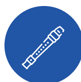
Flûte à bec