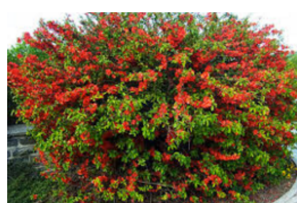
Cognassier du Japon