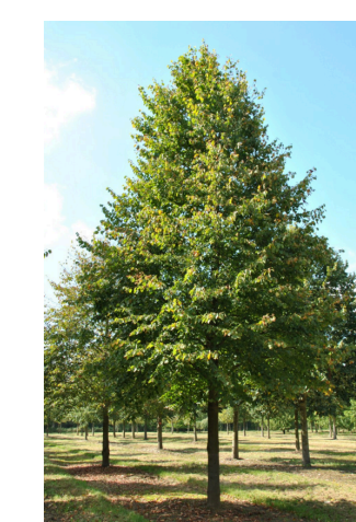
Tilleul à petites feuilles

- Composition pour les haies envisagée :