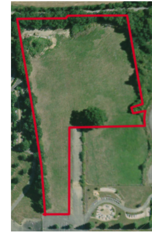
Vue aérienne actuelle du terrain