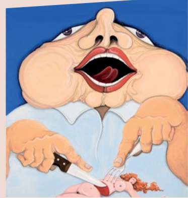
Le Bien Malotru - Michel Hénoçq

MANAS | Musée d'Art Naïf et d'Arts Singuliers Place de la Trémoille - www.musees.laval.fr - 02 53 74 12 30 Gratuit - Animations sur réservation