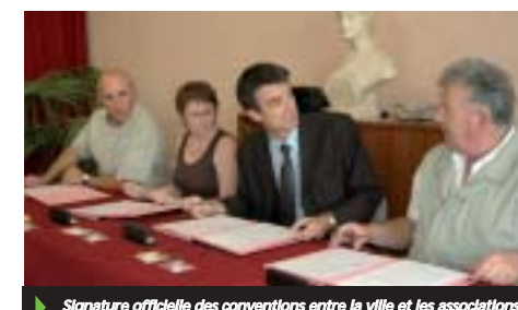
Signature officielle des conventions entre la ville et les associations

10 % du montant d'une première inscription dans une association. Egalement créée par la Ville, l'autre nouveauté concerne une plate-forme SMS destinée à informer les associations sur les différentes animations municipales.