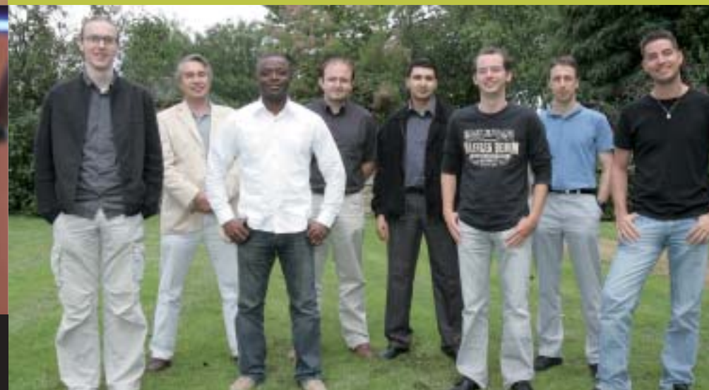
► Les 8 lauréats du Concours Idénergic 2007