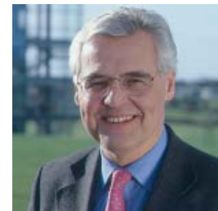
François d'AUBERT Président de LAVAL AGGLOMÉRATION Maire de LAVAL

À tous et à toutes, je vous souhaite une très belle rentrée !