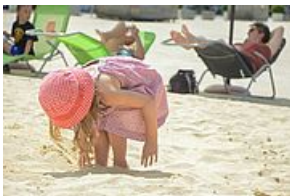
Laval Laval, la plage