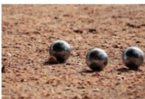
Châlons-du-Maine Tournoi de pétanque