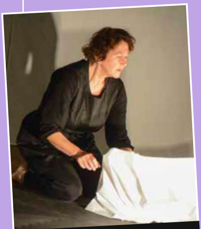
Spectacle "Papiers" par la compagnie "des rOnds dans l'eAu". Très apprécié des tous petits à Argentré le 10 octobre dernier , il sera proposé à Changé le 21 novembre et à Laval le 20 décembre prochains.

L'art contemporain n'est pas réservé aux initiés ! Découvrez-le au travers d'œuvres multiples, sur différents supports. Un coffret de 30 livres d'artistes, prêtés par Le Fonds régional d'art contemporain (FRAC), vous invite à entrer dans l'univers des plasticiens, par le toucher et la lecture. En parallèle, diverses animations sont prévues dans les bibliothèques de l'agglomération :