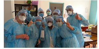
COVID-19 & SOLIDARITÉ