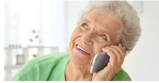
COVID-19 & SOLIDARITÉ