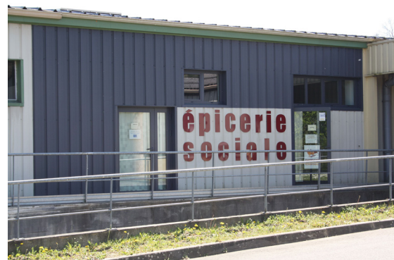
Locaux de l'épicerie sociale à Loiron-Ruillé

Les 30 novembre et 1 er décembre 2018, la Communauté de communes participait à la collecte de la Banque Alimentaire, au Super U du Bourgneuf-la-Forêt et à l'U Express de Loiron-Ruillé. Ces denrées ont été acheminées vers la banque alimentaire de Laval qui redistribue équitablement, à l'échelle départementale, les produits de la collecte aux plus démunis.