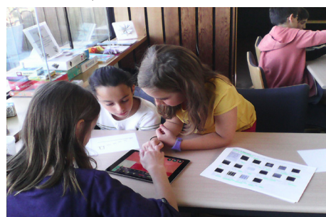
Atelier rétrogaming, médiathèque Loiron-Ruillé