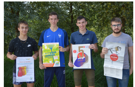
Chantiers argent de poche - juillet 2018

La Communauté de communes a organisé pour la 10 ème année consécutive des opérations dédiées aux chantiers « Argent de poche » pour les jeunes entre 16 et 18 ans. 41 chantiers ont été mis en place dans des domaines variés : travaux horticoles, bricolage (peinture, ponçage,...) et travail administratif.