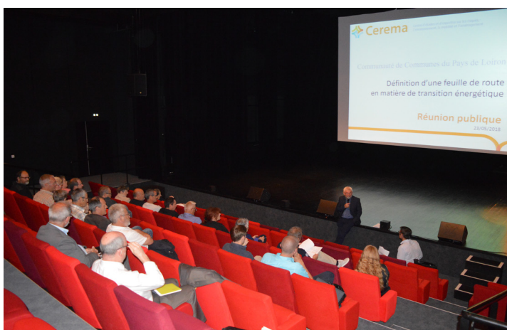
Réunion publique sur la transition énergétique CEREMA 23 mai 2018