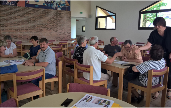
« Bistrôts de parole » autour du Plan Local d'Urbanisme Intercommunal sur les 3 zones du territoire 26 juin / 2 et 3 juillet 2018