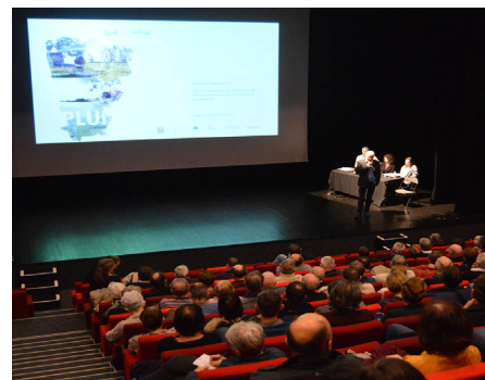
Réunion publique PLUi

Suite à la fusion, le projet de PLUi a été arrêté le 12 décembre 2018, lors du Conseil communautaire et sera soumis à enquête publique au printemps 2019.