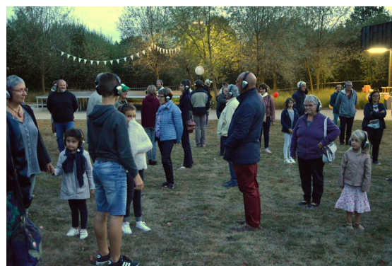
« Happy Manif » spéciale anniversaire des 3 Chênes par la Cie David Rolland - Sept. 2019