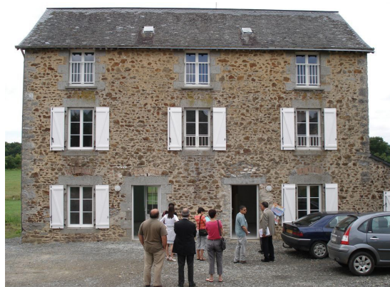
Visite d'une maison en rénovation à Saint-Ouen-des-Toits