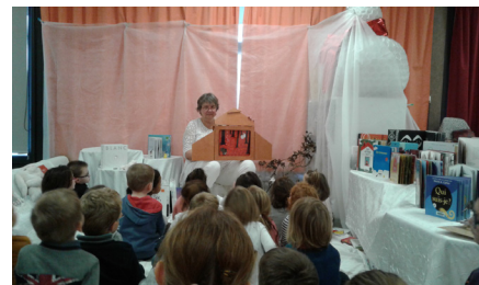
Accueil des scolaires

Le budget accordé à la programmation 2017-2018 s'est élevé à 9 549 €, dont 33% subventionné par le Conseil départemental dans le cadre de la convention culturelle intercommunale.