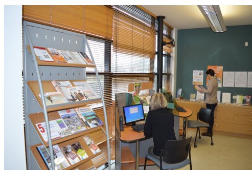
Maison de services au public