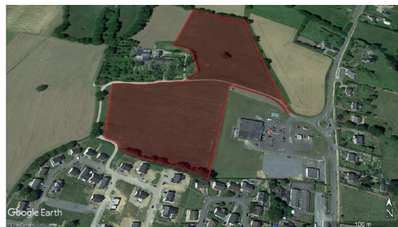
Zone d'activité de Chantepie à Loiron-Ruillé

L'étude de maîtrise d'œuvre pour la réalisation de la zone d'activités, située à Loiron-Ruillé, s'est poursuivie en 2018. La viabilisation de la zone est prévue pour 2019/2020. Cette zone d'une surface cessible d'environ 5 ha pourra être aménagée en deux tranches. Elle sera à vocation commerciale et services.