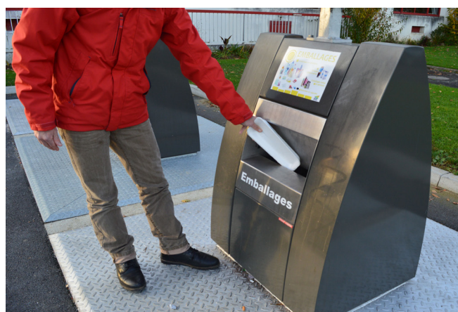
Geste de tri