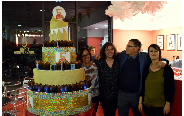
Week-end anniversaire pour les 5 ans du Théâtre des 3 Chênes. 21 et 22 septembre 2018