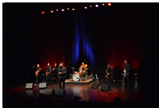
Concert de l'artiste américain De Robert - mars 2018

Comme chaque saison, l'objectif de la programmation a été de proposer aux publics des spectacles aux genres et formes variés (théâtre, musique, danse, chanson, cirque, arts du récit et du conte, arts de la marionnette, théâtre d'objets...), de qualité et professionnels, mettant en avant de nombreux artistes de découverte. Il s'agit de faire découvrir au public la richesse et la diversité des expressions artistiques actuelles, dans un contexte de proximité et de convivialité. La qualité des spectacles proposés par la saison culturelle du Pays de Loiron est reconnue, et le public curieux fait confiance à la programmation.