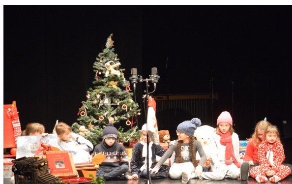
Concert de Noël - 15 décembre 2018