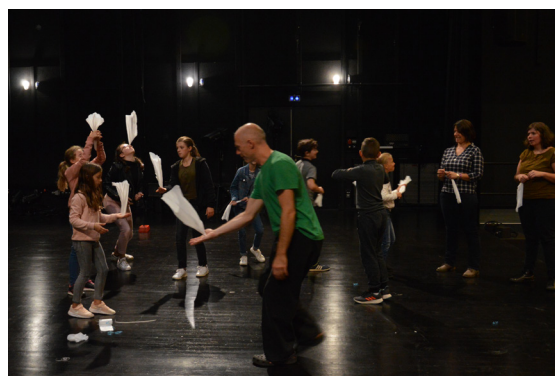
Atelier jonglage avec l'artiste Jörg Müller

Le Pays de Loiron inscrit également chaque année l'aide à la création dans son projet artistique afin de favoriser l'accompagnement de compagnies dans la création de nouveaux spectacles. La saison culturelle propose chaque saison un ou plusieurs temps de présence d'artistes lors de résidence et de rencontres.