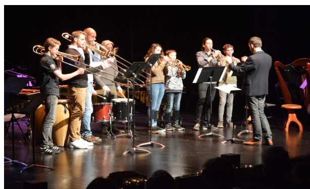
Concert de Noël - 15 décembre 2018