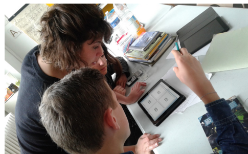
BD Numérique - Le Genest-Saint-Isle