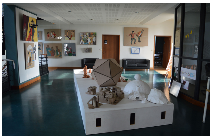
Vernissage de l'exposition d'Arts Plastiques à la Maison de Pays 8 juin 2018