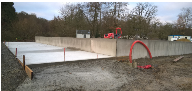
Travaux d'extension de la déchetterie de Port-Brillet Novembre 2018

Au-delà des déchetteries, 63 points d'apport volontaire répartis sur les 14 communes accueillent le verre, tous les papiers, les emballages métalliques et plastiques. Depuis les nouvelles consignes de tri, de juillet 2016, qui encouragent le tri de tous les emballages plastiques, au-dehors des bouteilles et flacons (pot, barquette, film), les quantités collectées ont nettement progressées pour atteindre, + 7 kg par habitant en moyenne par an.