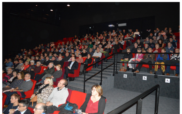
Réunion publique sur la fusion aux 3 Chênes 14 novembre 2018