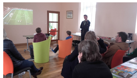
FIFA 2018 - Bibliothèque de la Brûlatte