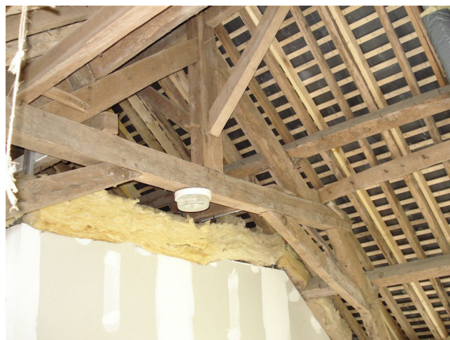
Maison en rénovation à Saint-Ouen-des-Toits