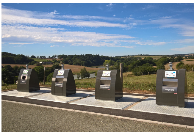
Points d'apport volontaire