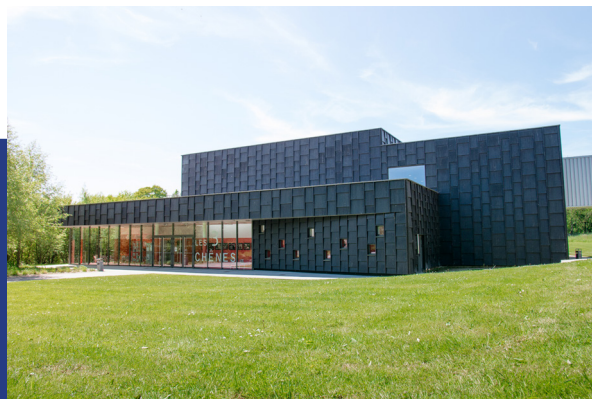
Le Théâtre des 3 Chênes à Loiron-Ruillé