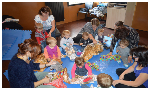
Atelier découverte sonore