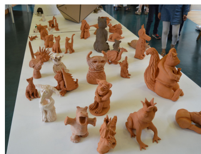
Exposition annuelle des élèves de l'école d'Arts Plastiques à la Maison de Pays à Loiron-Ruillé