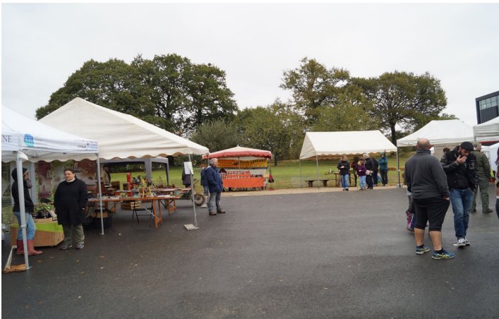
3ème édition du Vide Jardin à la Maison de Pays à Loiron-Ruillé 7 octobre 2018