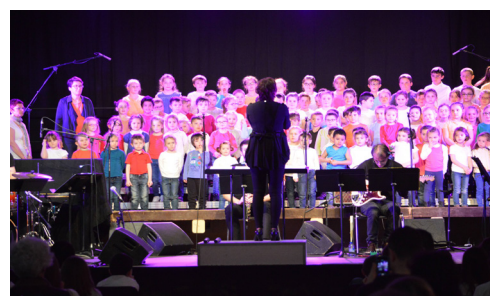
Chorale des enfants