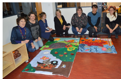
Conception de tapis sensoriels lors d'ateliers

Un accompagnement dans l'exercice de leur profession : temps de rencontre, mise à jour des coordonnées et disponibilités d'accueil, informations juridiques, sur les conditions d'accès et l'exercice de la profession. À la demande des assistant(e)s maternel(le)s, des formations sont organisées en semaine, sur leur temps de travail comme tous les professionnels. Ainsi, en 2018, 2 formations ont été proposées dont 2 sessions en semaine et une le samedi. (thème abordé : s'occuper d'un enfant en situation de handicap).