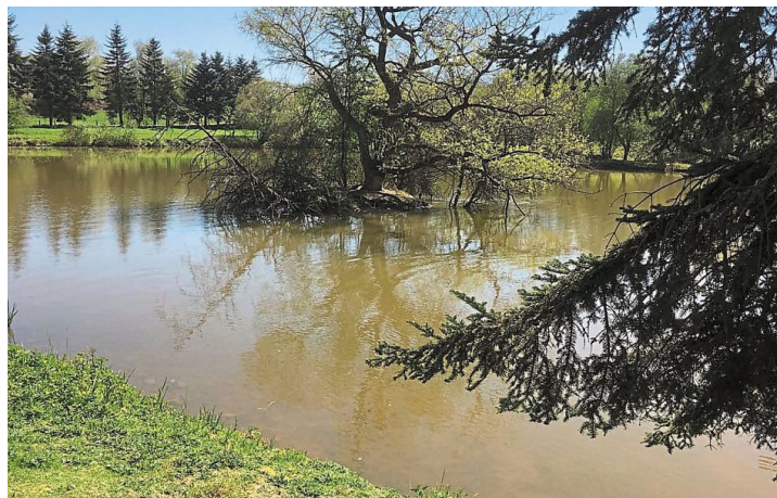
Inauguration du Refuge LPO (Ligue pour la Protection des Oiseaux) avec Mayenne Nature Environnement (MNE) à l'Ecoparc de La Gravelle (1 ère zone d'activités à obtenir le label en Mayenne) 18 avril 2018