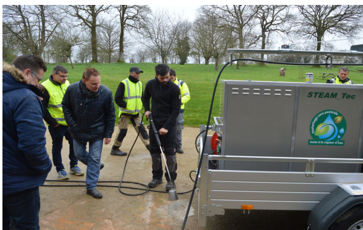
Manipulation du matériel de désherbage

Chaque année, des investissements permettent le renouvellement du parc matériel et roulant. En 2018, le service acquérait un désherbeur thermique pour l'entretien des espaces vert, en concertation avec l'ensemble des agents communaux. Cette action intitulée «Désherbage alternatif aux produits phytosanitaires et santé des agents des services techniques» a obtenu le label PRSE3 «Agir pour un environnement favorable à la santé». Le Plan Régional Santé Environnement 2016-2021 (PRSE3) est porté par le Préfet des Pays de la Loire (DREAL), le directeur général de l'Agence Régionale de la Santé (ARS) et la Présidente du Conseil régional.