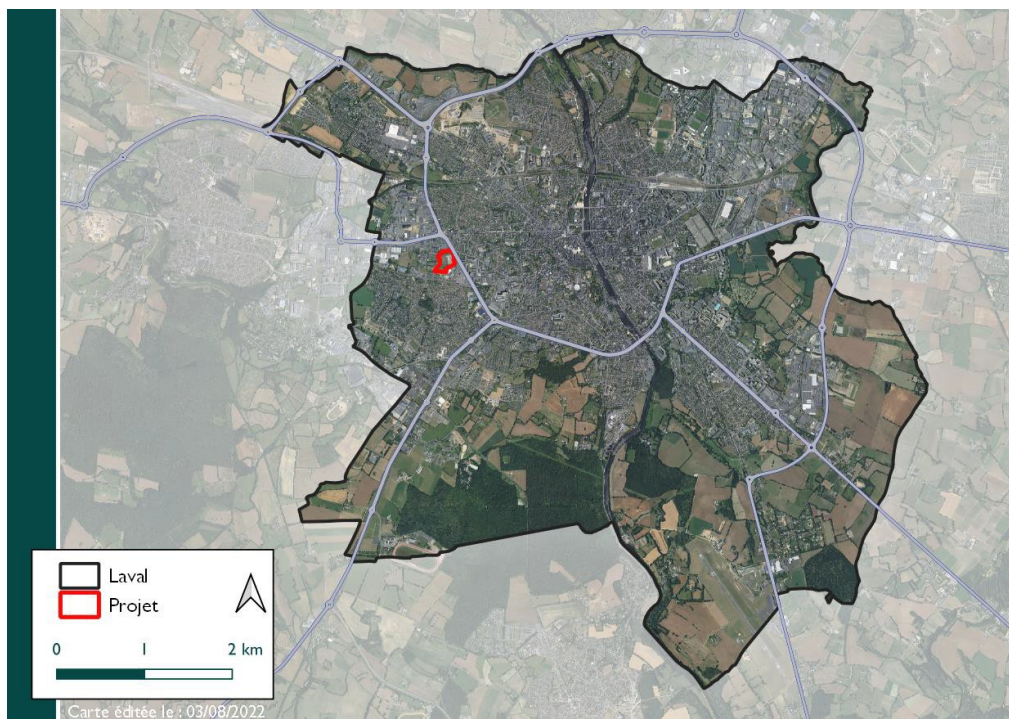
Figure 1: Situation géographique sur le territoire de la commune de Laval

(PC) constituant l'opération (le PC1 porte sur les immeubles A, B, C, D et E et le PC2 porte sur le bâtiment F), une étude d'impact portant sur le périmètre global de cette dernière a été conduite.