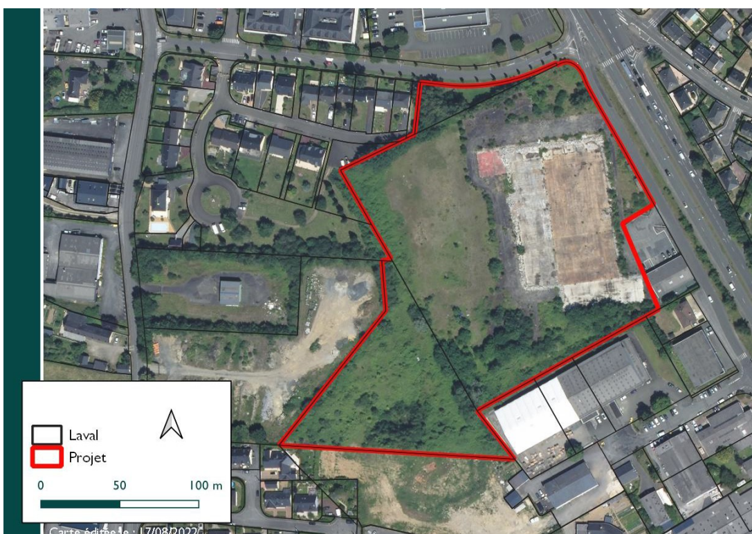
Figure 2: Vue aérienne du site du projet