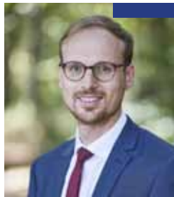
Florian BERCAULT PRÉSIDENT DE LAVAL AGGLOMÉRATION