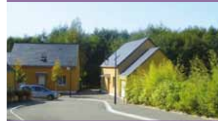
PRÉSERVATION DES MILIEUX NATURELS