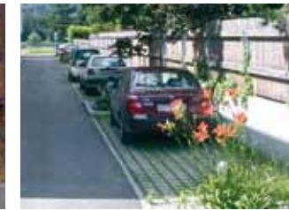
PERMÉABILISATION DES SOLS