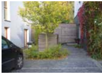
MATÉRIAUX SAINS ET ÉCOLOGIQUES