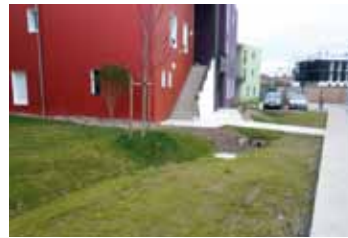
RÉCUPÉRATION ET GESTION DE L'EAU